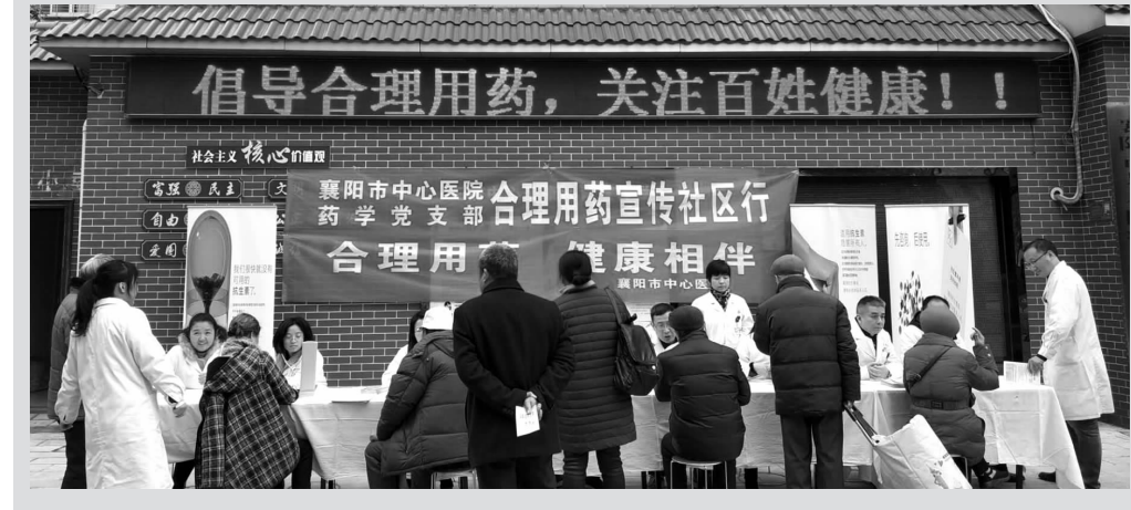
为提高公众的安全用药意识和水平,11月22日,药学党支部开展了主题为“合理用药健康相伴”的健康宣传活动。活动现场通过发放宣传册、现场答疑等形式,向辖区居民宣传了合理用药科普常识。当天共接待咨询群众100余人次,发放宣传册200余份。(曹军华)