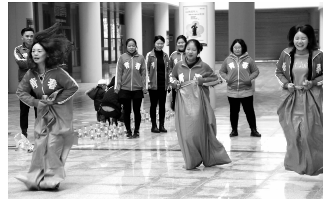
表示这种活动形式新颖,参与性和趣味性高,能够增进职工之间的关系。院团委将进一步探索更多更好的活动,让更多的青年参与到活动中来,切实为团员青年青年服务。

本报讯(记者 肖清心)为丰富广大团员青年的业余文化生活,增强青年团队协作意识,提高团组织凝聚力,11月19日,襄阳市中心医院团委在东津院区举行了一场青年趣味运动会,来自全院18个团支部的72名选手参加了比赛。