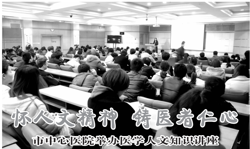
市中心医院举办医学人文知识讲座

路虽远,行则将至;事虽难,做则必成。新的一年,市护理质控中心将开启新的征程,怀揣新的目标,继续砥砺前行,充分发挥区域质控中心作用,有序有效地推进我市护理各项工作的开展。