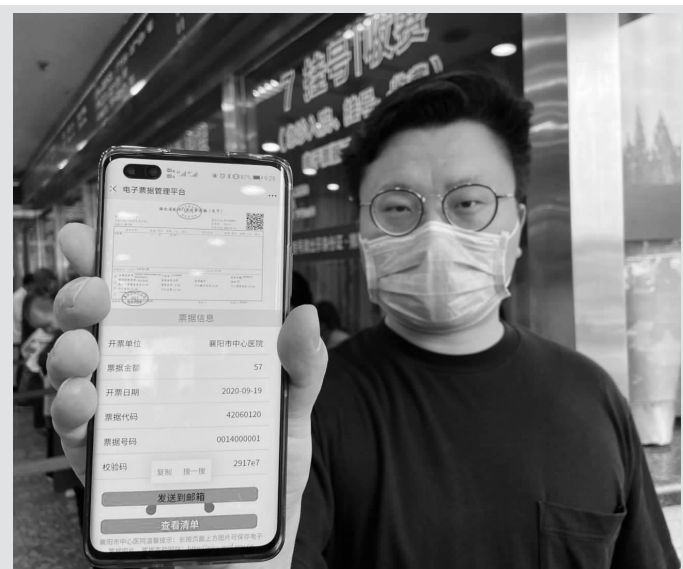
9 月 19 日上午,襄阳市中心医院财政电子票据管理系统正式上线,并在 9:35 成功开具全市第一张收费电子票据。首张医疗电子发票的开出,不仅标志着我市财政票据正式迈入无纸化时代,也标志着襄阳市中心医院打通了信息化建设的“最后一公里”,实现了从预约挂号、线上缴费到电子票据推送等“一站式”服务。