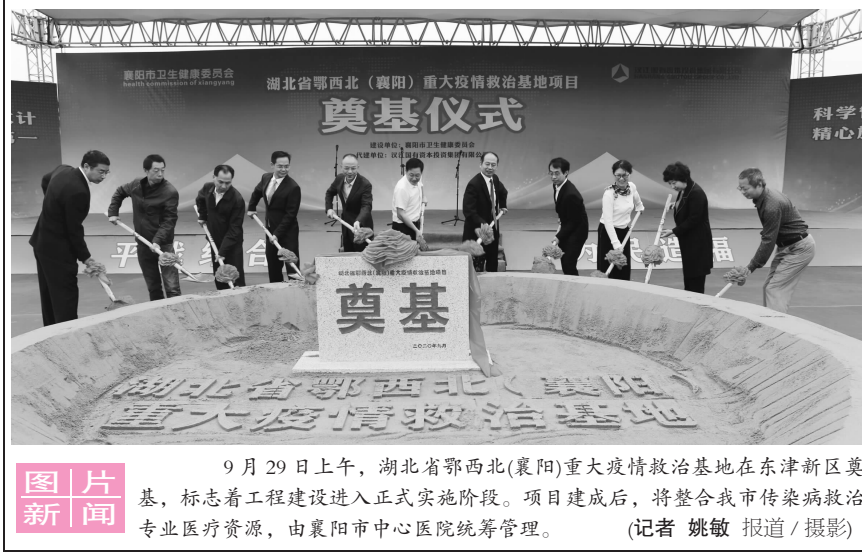
9 月 29 日上午,湖北省鄂西北(襄阳)重大疫情救治基地在东津新区奠基,标志着工程建设进入正式实施阶段。项目建成后,将整合我市传染病救治专业医疗资源,由襄阳市中心医院统筹管理。(记者 姚敏 报道/摄影)

医治疗相结合,实施精准救治。疫情期间,医院累计收治新冠肺炎确诊和疑似患者 1450 例。襄阳首例新冠肺炎治愈患者解除隔离康复出院,襄阳首例新冠肺炎孕妇顺利分娩,襄阳首例新冠肺炎患者恢复期血浆治疗顺利开展……每一位患者的救治,无不体现着医院的硬核实力;除承担本院定点救治任务外,医院还兼顾着全市重症、危重症患者的救治指导工作;医院成立心理疏导小组,通过线上、线下 24 小时服务,为一线职工和患者提供专业心理疏导、情绪支持。